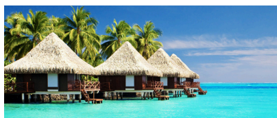
Les Maldives, Asie du Sud