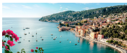
Côte d'Azur, France