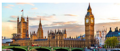
Grandes villes Européennes